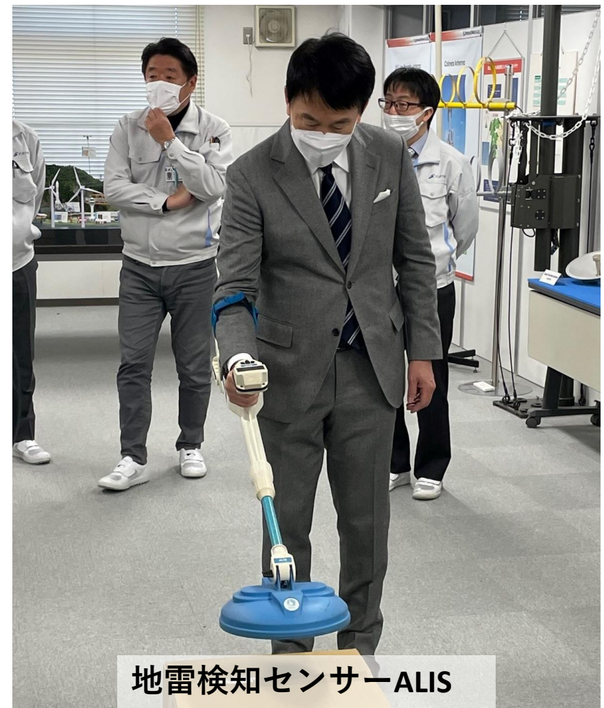
地雷検知センサーALIS