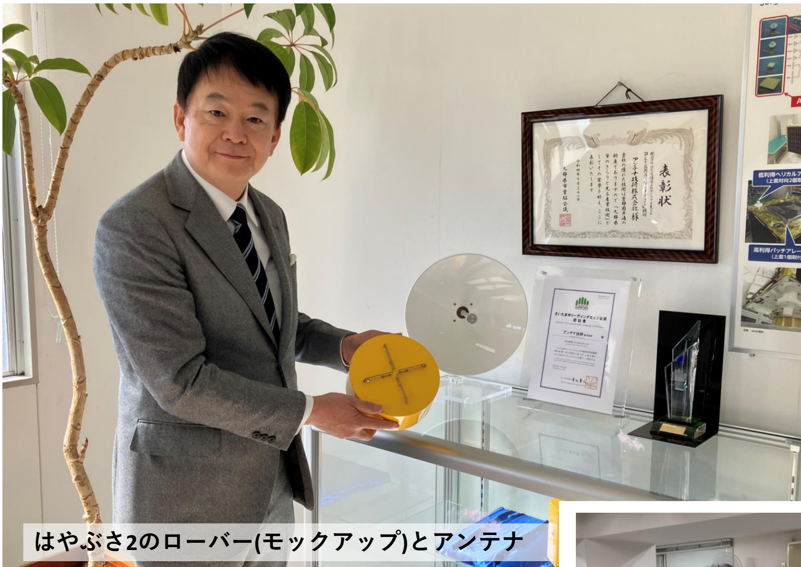
はやぶさ2のローバー(モックアップ)とアンテナ