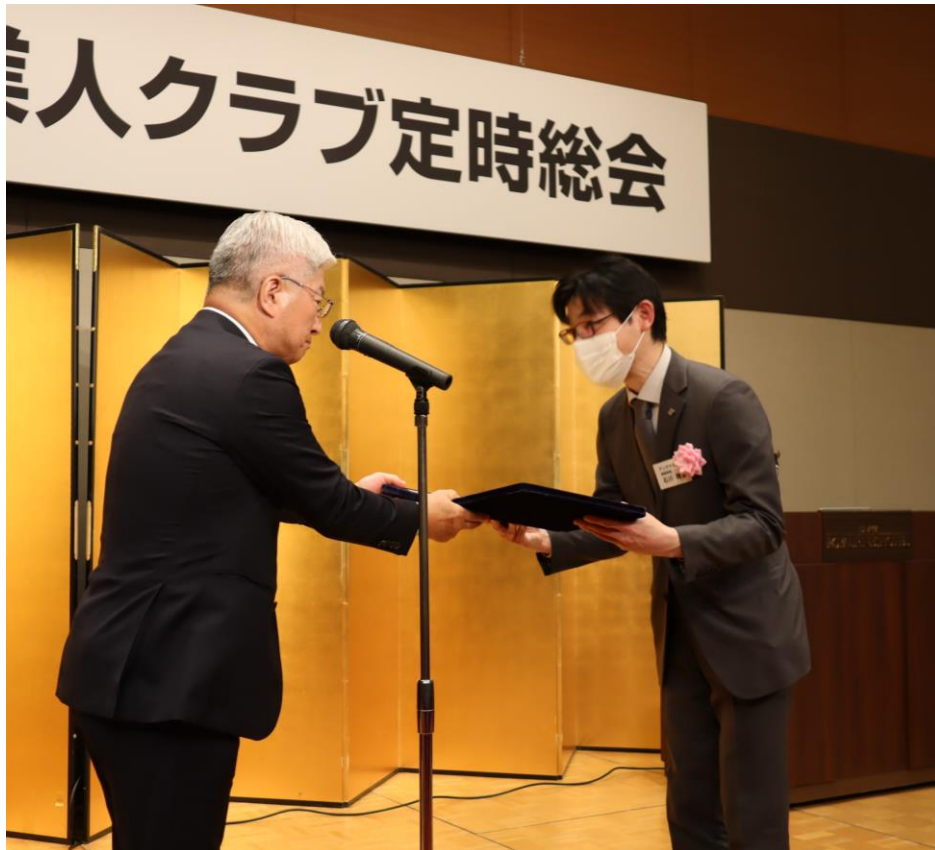
第42回西海記念賞 授賞式、埼玉産業人クラブ定時総会にて

弊社の衛星用アンテナ開発技術が 埼玉産業人クラブ様より「第42回西海記念賞」を受賞しました。 受賞対象：小惑星探査機「はやぶさ2」の探査ロボット「ローバー」に搭載された画像送信アンテナの開発。「ローバー」は小惑星「リュウグウ」に投下され、ジャンプしながら地表を調査し、弊社のアンテナを介して「はやぶさ2」にカラー画像を送信しました。